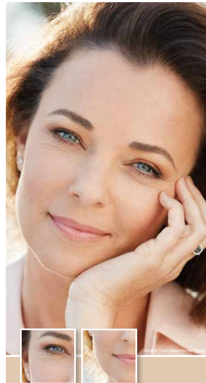
Modell – kein tatsächlicher Patient