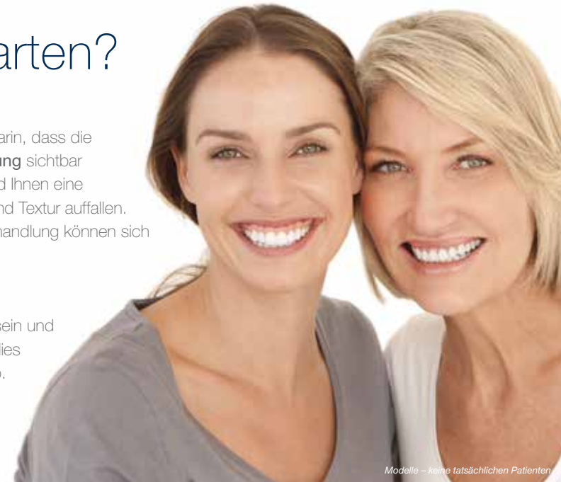
Modelle – keine tatsächlichen Patienten

Unmittelbar nach der Behandlung wird Ihre Haut warm sein und könnte leichte Rötungen und Schwellungen aufweisen; dies hängt von den individuellen Behandlungseinstellungen ab. Die meisten Patienten können innerhalb einer Woche wieder ihren täglichen Aktivitäten nachgehen. Es sollte eine tägliche Hautpflege verschrieben werden, um den Heilungsprozess zu unterstützen.